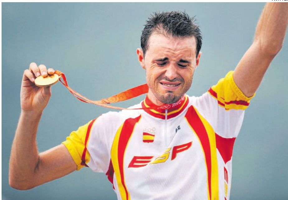
Samuel Sánchez, amb la medalla d'or en ciclisme en ruta als Jocs Olímpics de Pequín 2008.

Patiment. Sempre patiment. A Andorra com a ciclista professional només puc dir una paraula: patiment. És un territori que conec de ciclista i m'encanta i el conec també com a usuari d'esquí i m'apassiona. Com a preparació també vaig utilitzar els ports del país per preparar una Volta a Espanya al 2014. Molt bé tot plegat, però com a ciclista he patit molt.