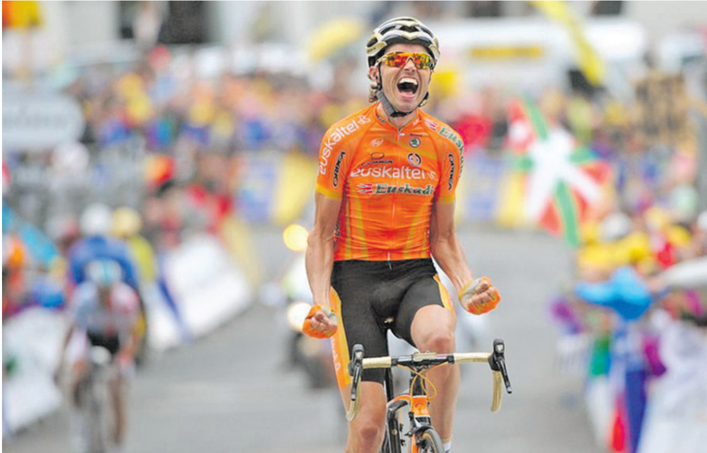
L'exciclista professional Samuel Sánchez a Luz Ardiden, on va aconseguir la seva única victòria d'etapa al Tour de França.