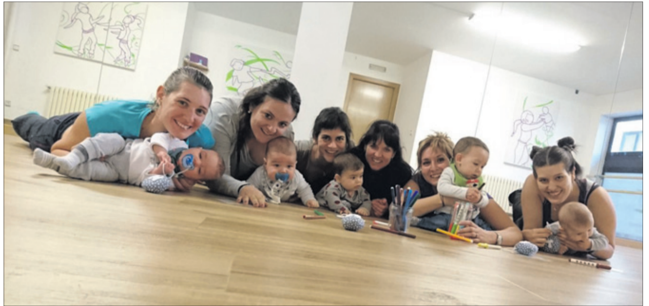
ROCK & ROLL BABIES! Els nostres ballarins més petits. Grup de dansa i moviment per a nadons de 0 a 12 mesos.