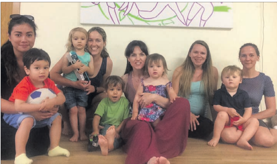
SWING BABIES Deixem córrer la imaginació. Grup de dansa i moviment per a bebès d'1 a 3 anys.