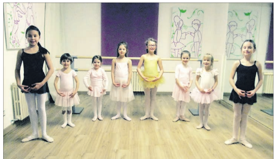
BALLET CLÀSSIC! Acabant el primer trimestre amb èxit, les nostres ballarines de ballet clàssic (4-10 anys).