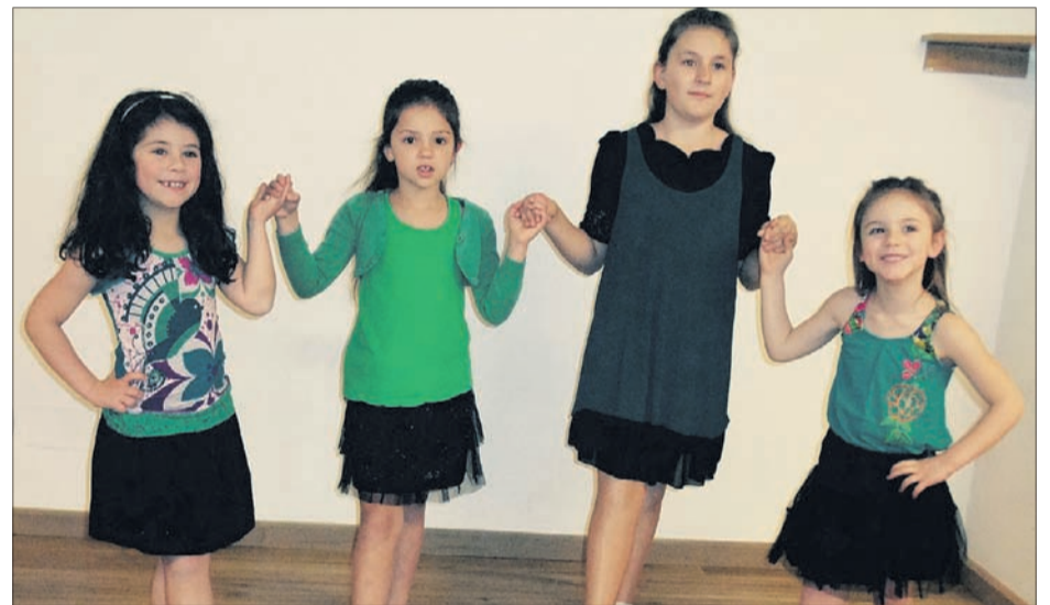
DANSA IRLANDESA! Grup d'iniciació de dansa irlandesa. Per aprendre a ballar com les estrelles de Riverdance!