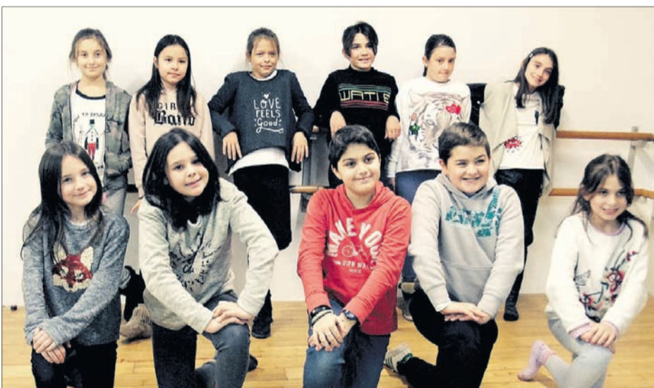
DANSA MODERNA! Grup de Dansa APA - Escola Francesa de la Massana (curs CM1-CM2).