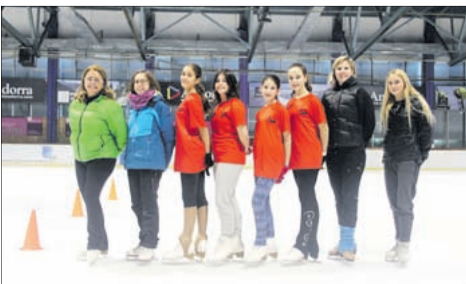
Grup C Grans i Glaçó 2 de l'Andorra Club Gel.