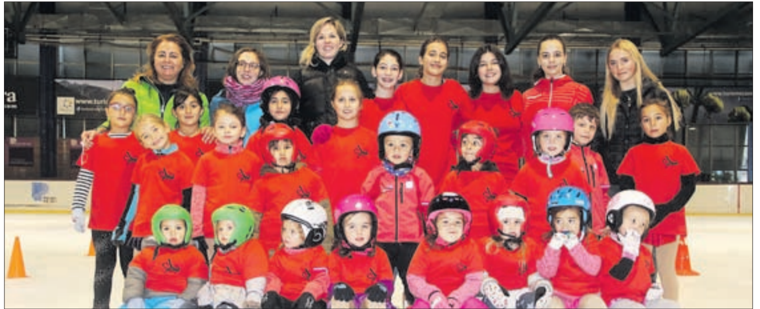
Grups d'escola i precompetició de l'Andorra Club Gel.