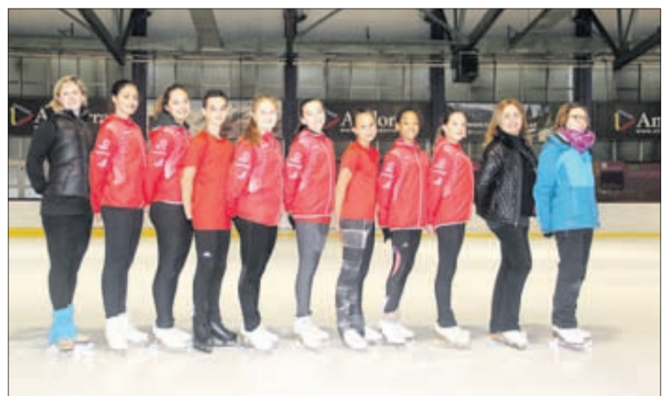
Grup Nacional de l'Andorra Club Gel.