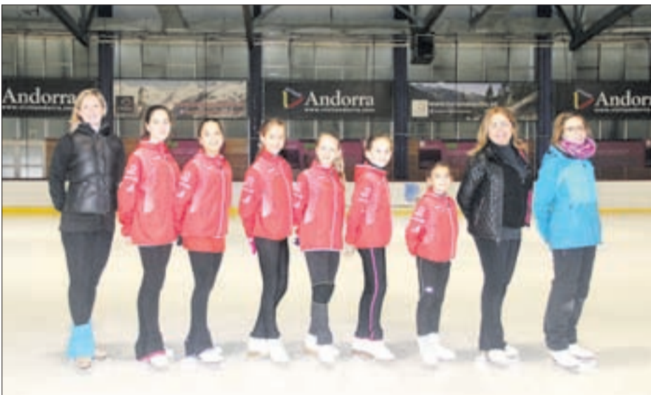
Grup A de l'Andorra Club Gel.