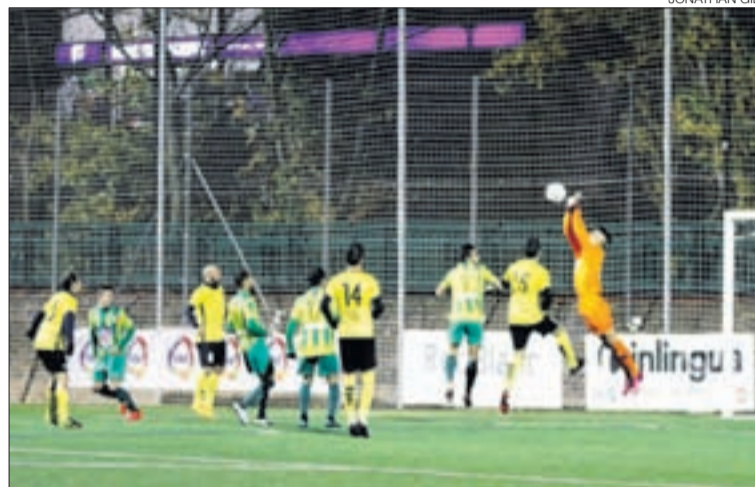
■ La UE Santa Coloma va reaccionar a temps contra l'UE Engordany.