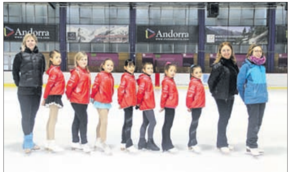
Grup B de l'Andorra Club Gel.