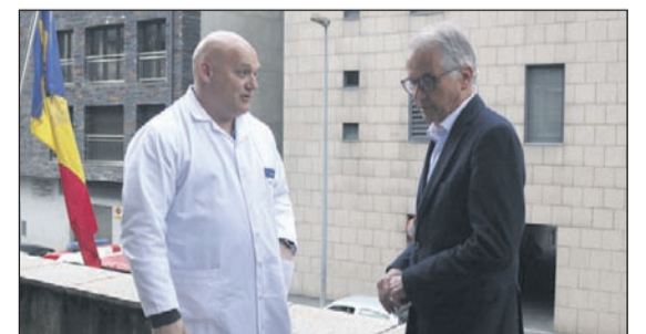
Conversa amb els doctors Piqué i Vilanova (pàgines de la 4 a la 8)