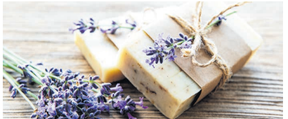
Fets a mà

De recordatoris que es poden comprar i personalitzar, fins a cert punt n'hi ha molts per escollir, a més dels ja esmentats més amunt. Entre els més originals hi ha petits testos amb plantetes, clauers, imants, xapes i espelmes, també pots de llaminadures, punts de llibre i tasses, entre